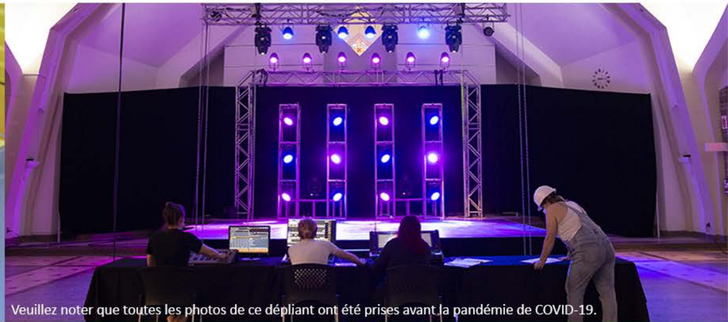
Veillez noter que toutes les photos de ce dépliant ont été prises avant la pandémie de COVID-19.