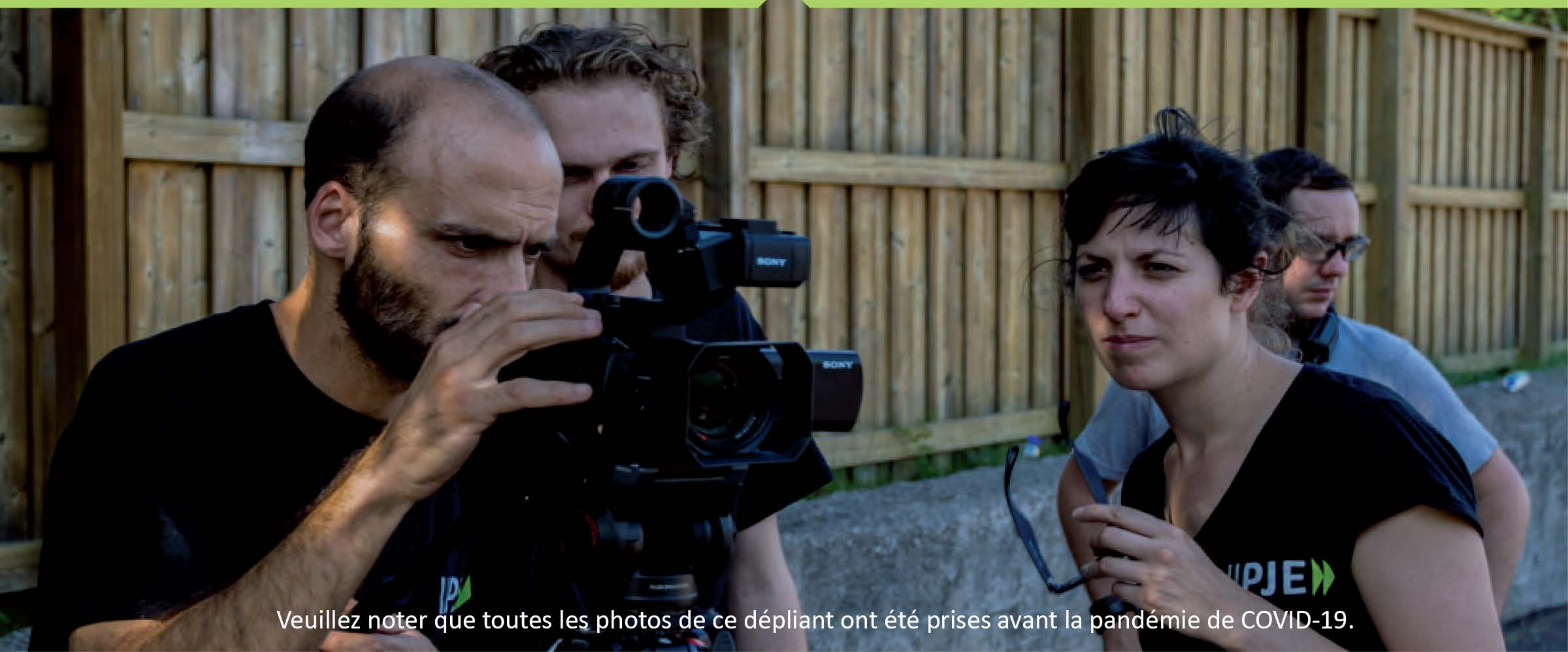
Veillez noter que toutes les photos de ce dépliant ont été prises avant la pandémie de COVID-19.