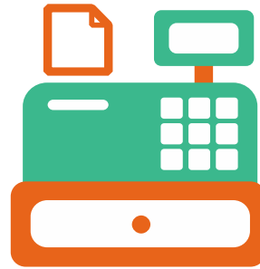
Service à la clientèle (caisse enregistreuse)